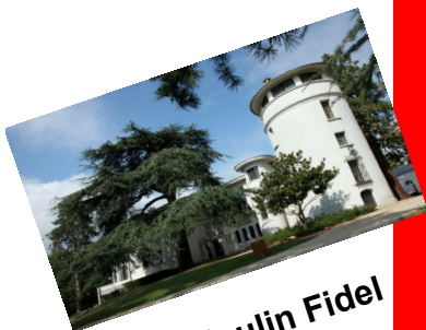
Le Moulin Fidel

Nous vous proposons une belle promenade dans le domaine départemental de la Vallée-aux-Loups, au Plessis-Robinson, samedi 8 juin.