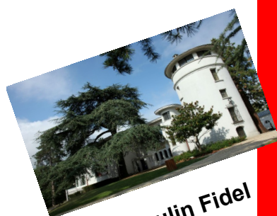
Le Moulin Fidel