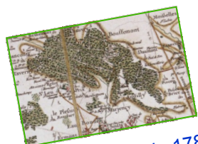
Carte de Cassini -1780