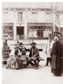
Famille napolitaine Saint-Germain Paris