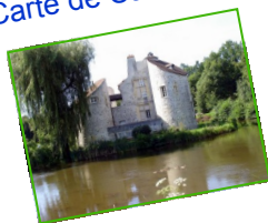
Le château de la Chasse