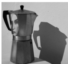
L'heure du café Alain Fleischer